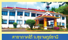
สาขาภาคใต้ จ.สุราษฎร์ธานี

เปิดทำการ วันจันทร์ - วันศุกร์ เวลา 08.30น. - 17.00น. ปิดทำการ วันเสาร์ - วันอาทิตย์ และ วันหยุดนักขัตฤกษ์