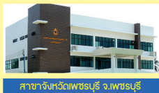
สาขาจังหวัดเพชรบุรี จ.เพชรบุรี